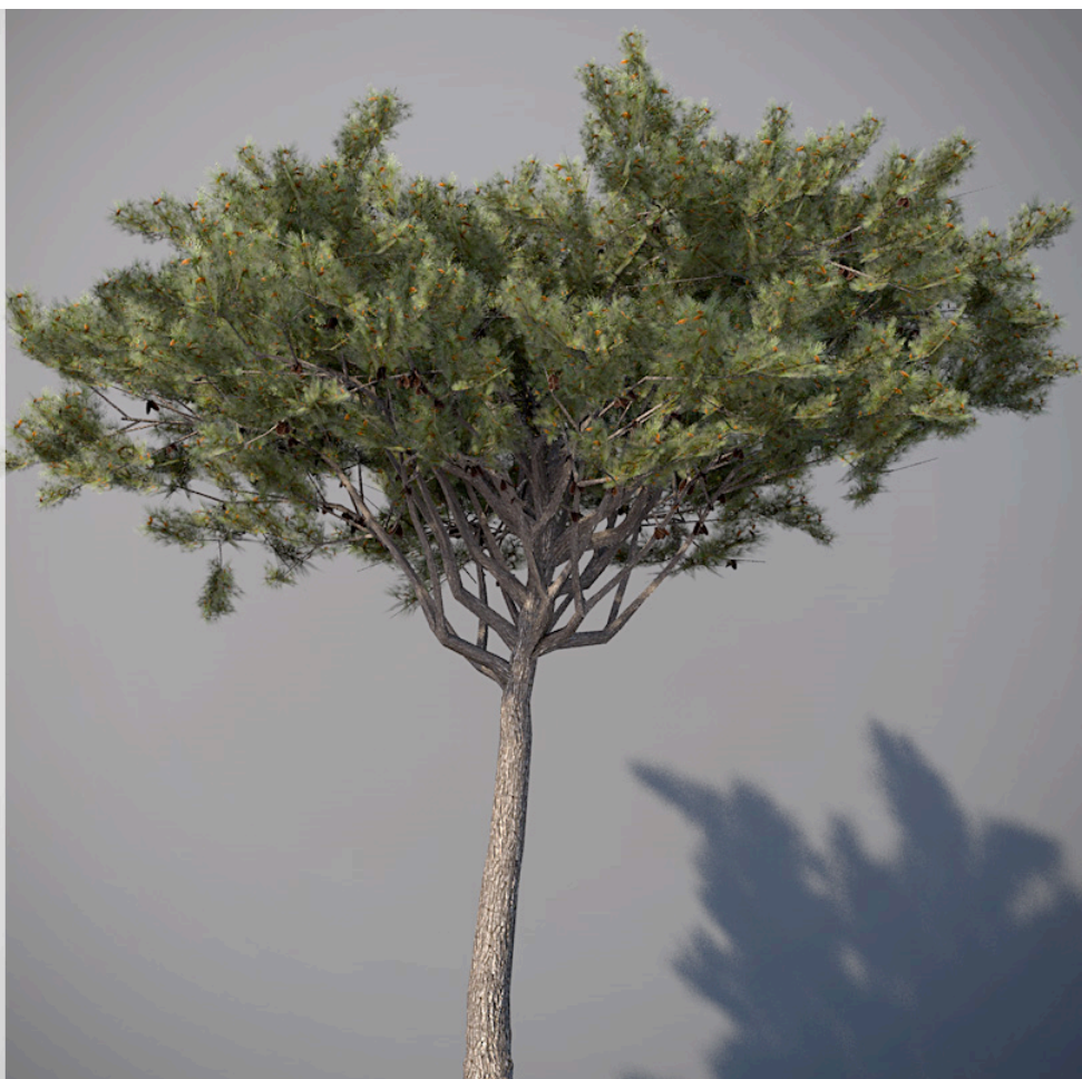
● Pino domestico - Italian stone pine