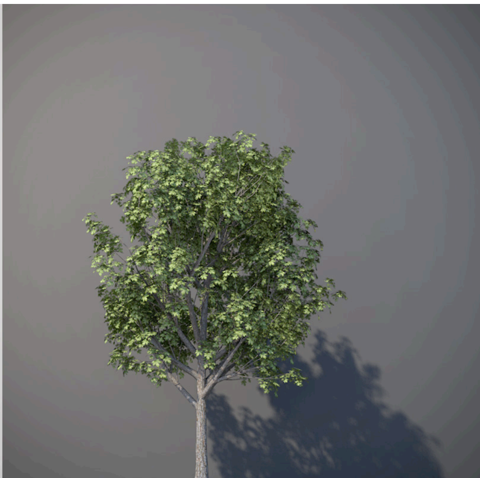
● Acero campestre - Acer campestre