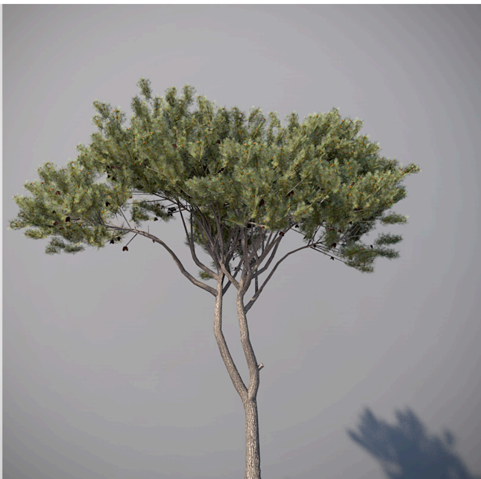
● Pino domestico - Italian stone pine