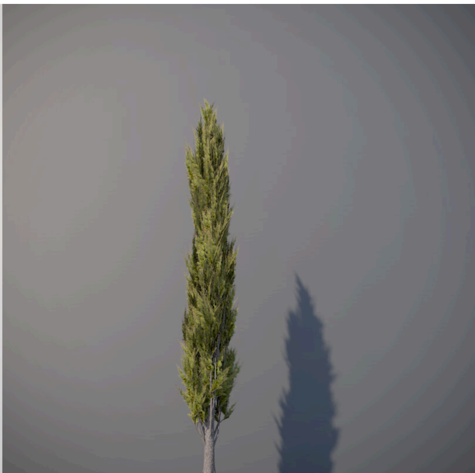
● Cipresso italiano - Italian cypress