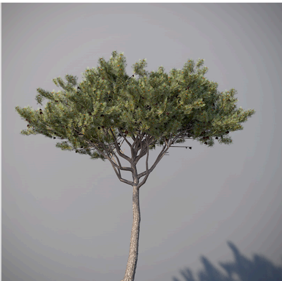
● Pino domestico - Italian stone pine