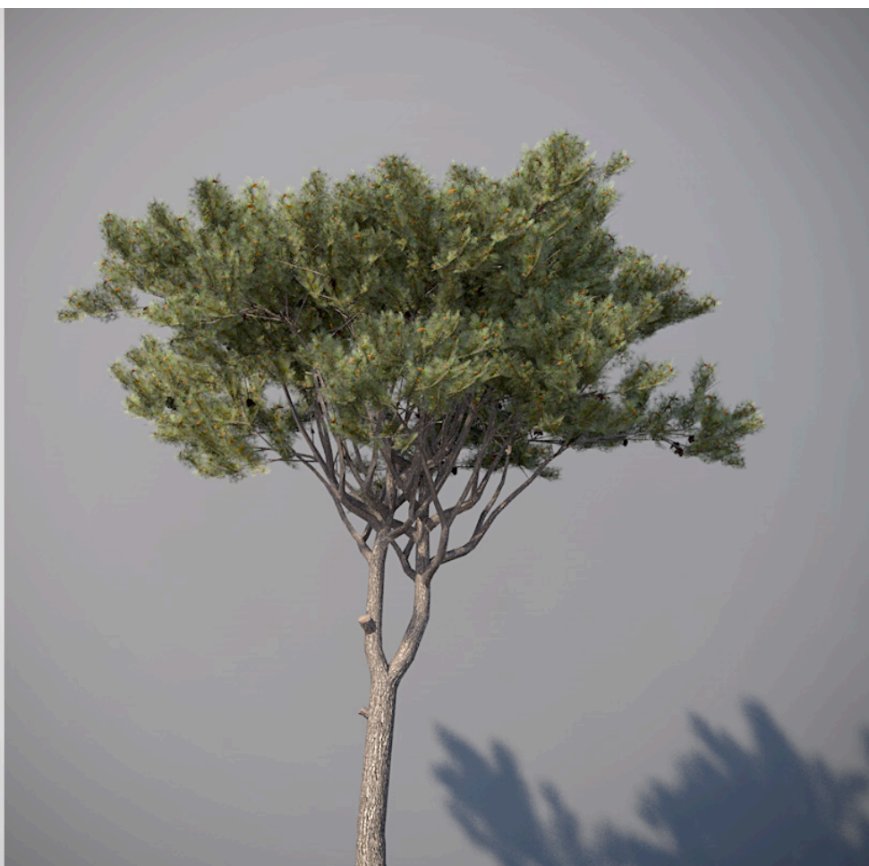
● Pino domestico - Italian stone pine