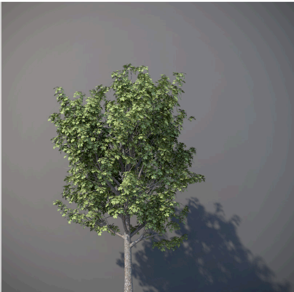
● Acero campestre - Acer campestre