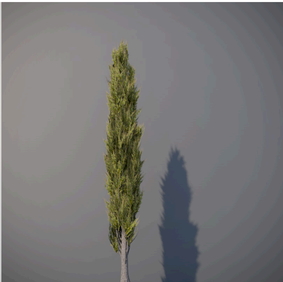
● Cipresso italiano - Italian cypress