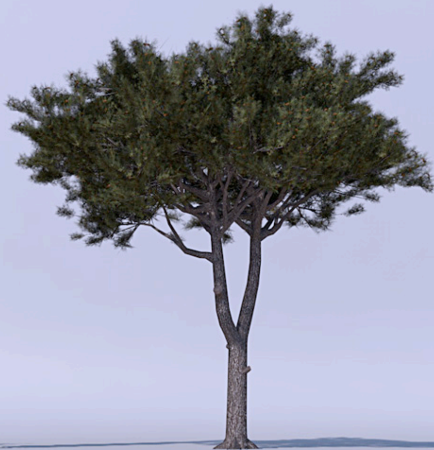
Italian Stone Pine

This collection is specially designed for