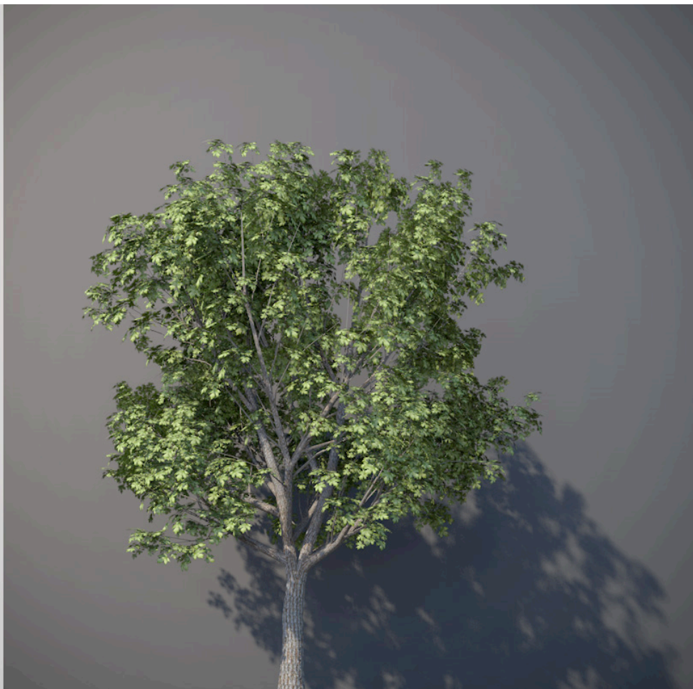
● Acero campestre - Acer campestre