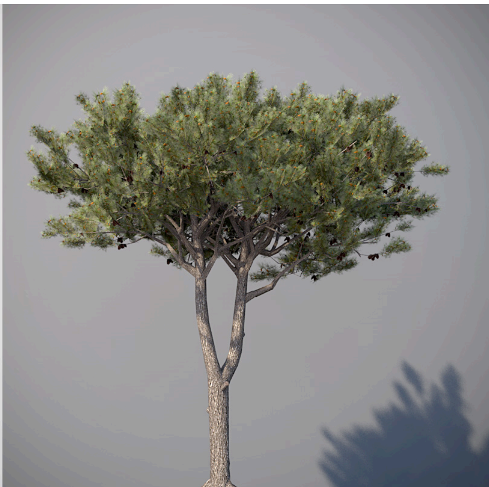
● Pino domestico - Italian stone pine