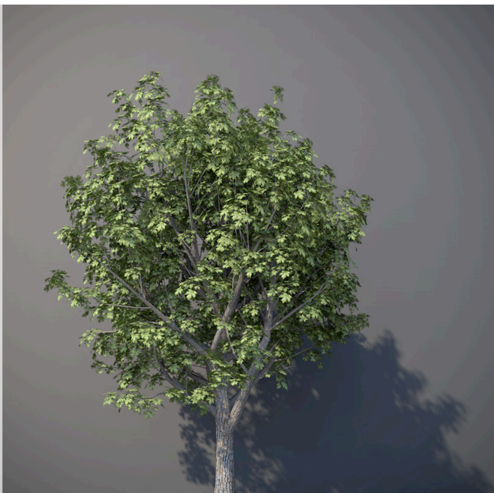
● Acero campestre - Acer campestre