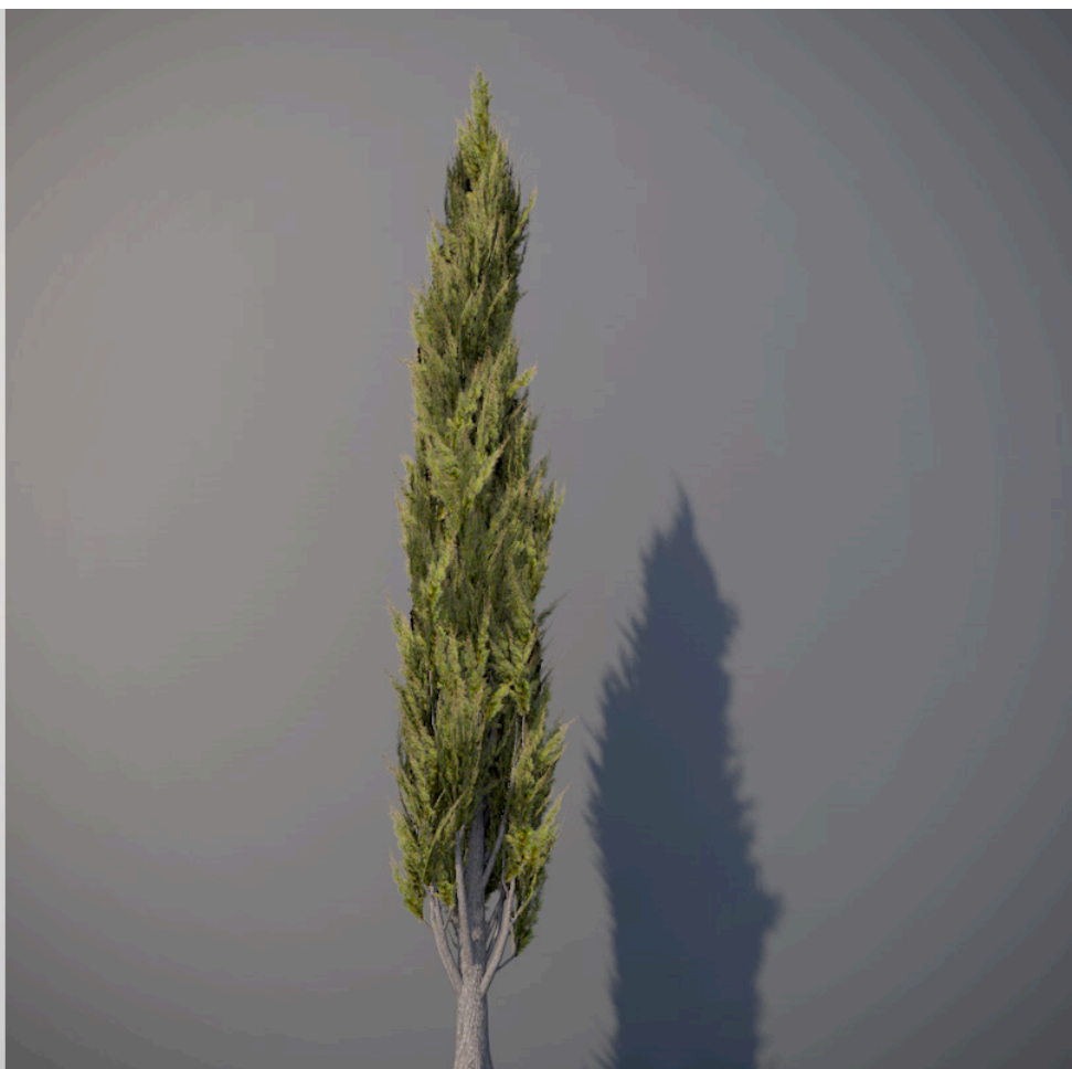
● Cipresso italiano - Italian cypress