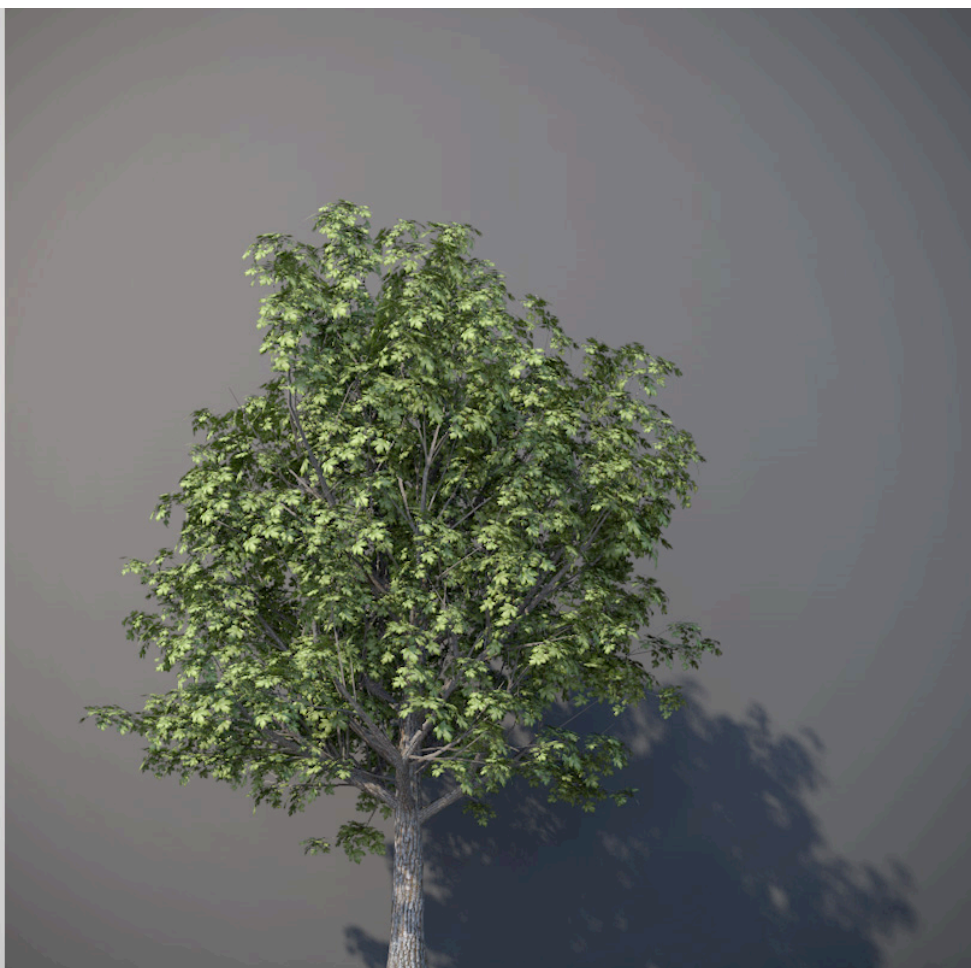
● Acero campestre - Acer campestre