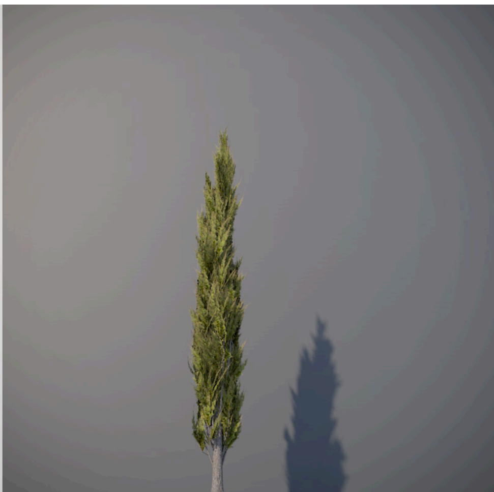
● Cipresso italiano - Italian cypress