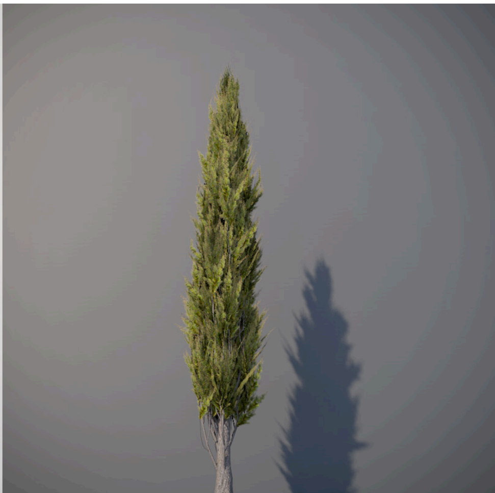
● Cipresso italiano - Italian cypress