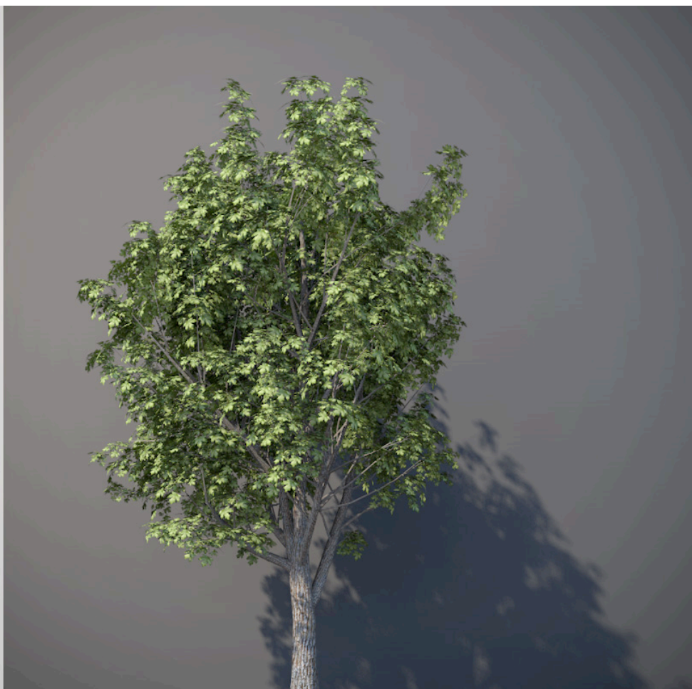
● Acero campestre - Acer campestre