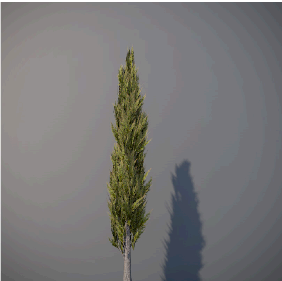
● Cipresso italiano - Italian cypress