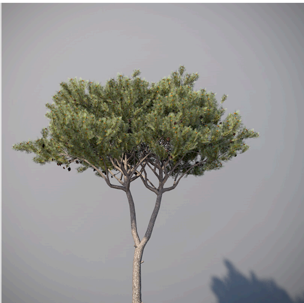
● Pino domestico - Italian stone pine